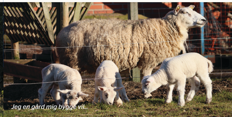
Jeg en gård mig bygge vil...