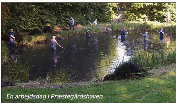
En arbejdsdag i Præstegårdshaven

Vi er et lokalsamfund med mange ildsjæle i alle aldre, der ønsker at gøre en forskel. Her er et højt aktivitetsniveau, der bygger på stor frivillighed. Vi har gode fællesskaber i mange uformelle, åbne netværk. Hos os har og dyrker vi mange traditioner.