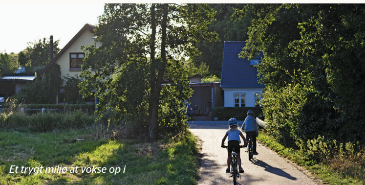
Et trygt miljø at vokse op i

Her kan du læse meget mere om, hvad her foregår. Flere lokale institutioner og foreninger er også på Facebook.