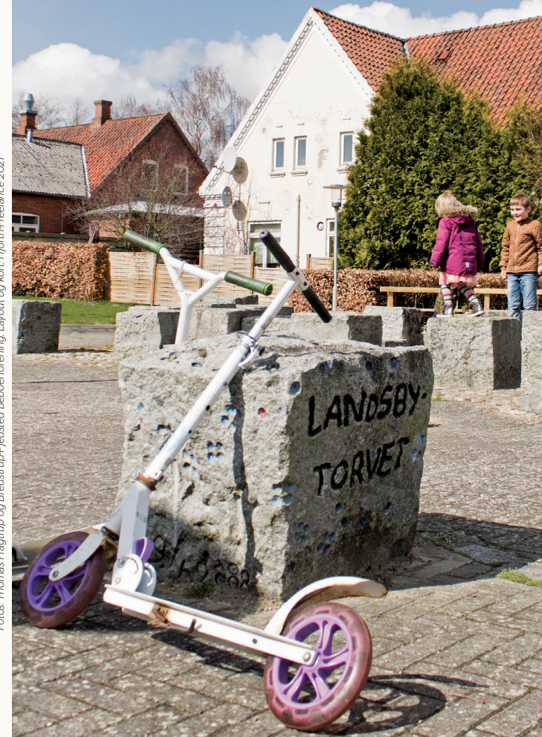
Layout og kort: Hjørth-Freelance 2021