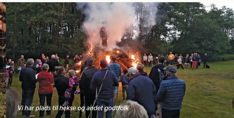
Vi har plads til hekse og andet godtfolk