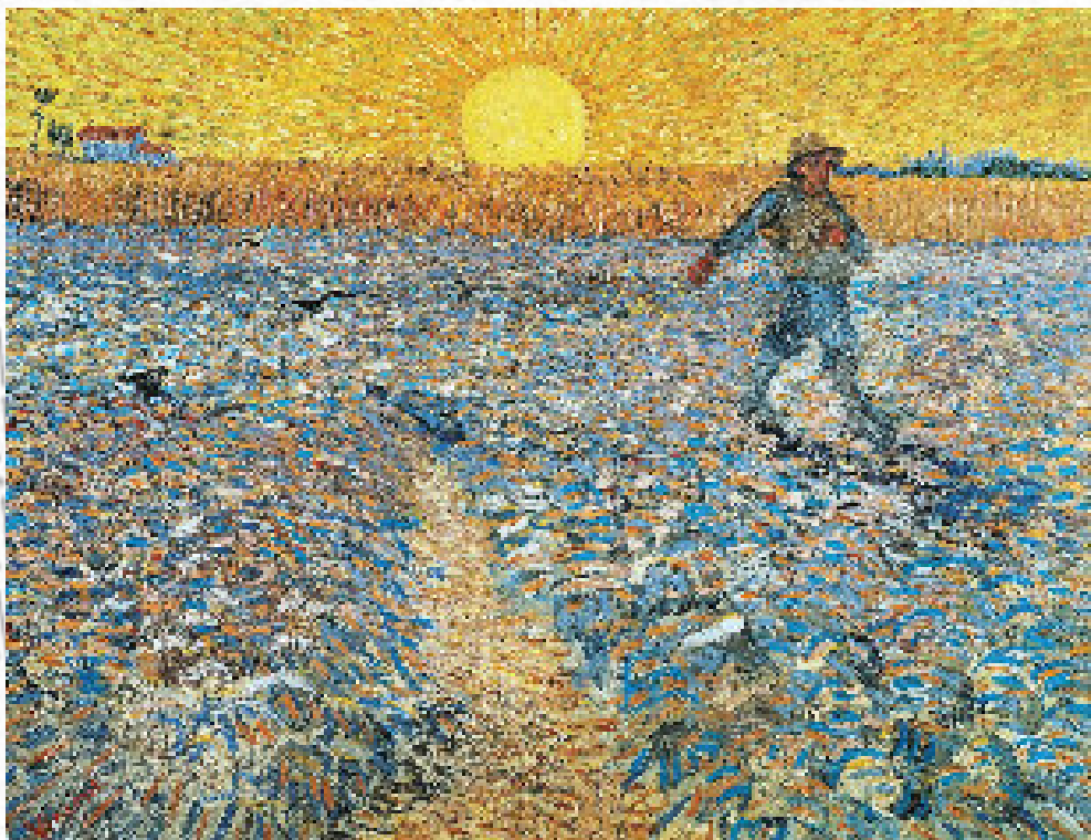
Sædemanden - malet af Vincent van Gogh

Juli - August - September - Oktober - November 2019