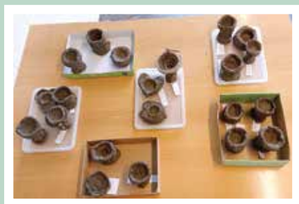
Minikonfirmanderne har modeleret flotte døbefonde i ler.