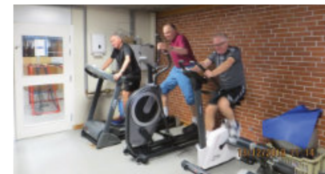
Seniormotion i fuld sving