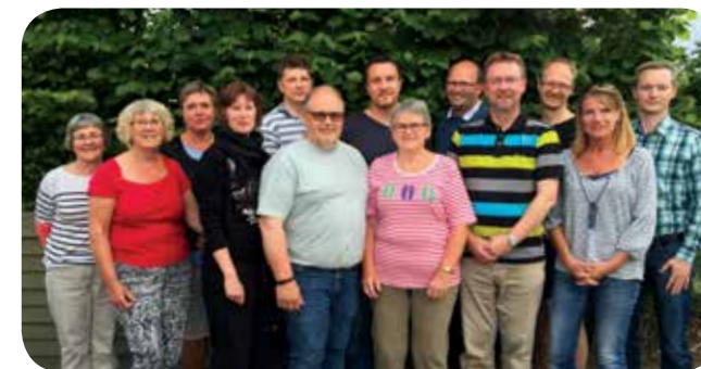
BPI's nye hovedbestyrelse